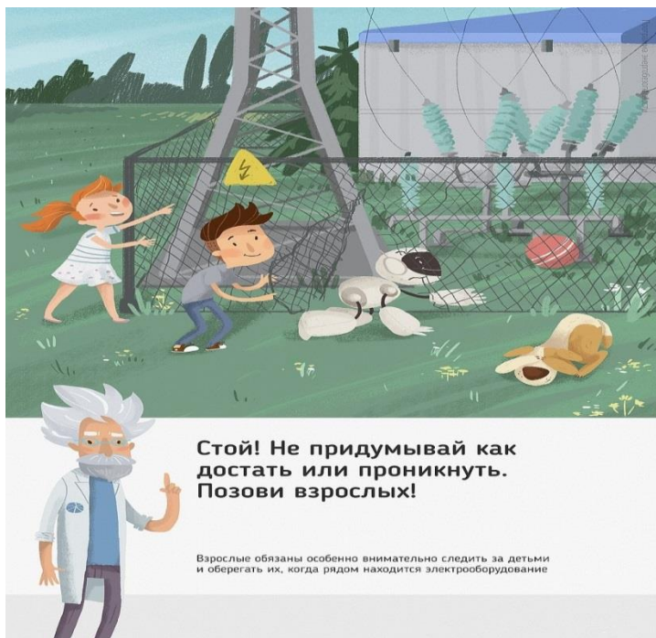
Рис. 5 Стой! Не придумывай как достать или проникнуть. Позови взрослых!