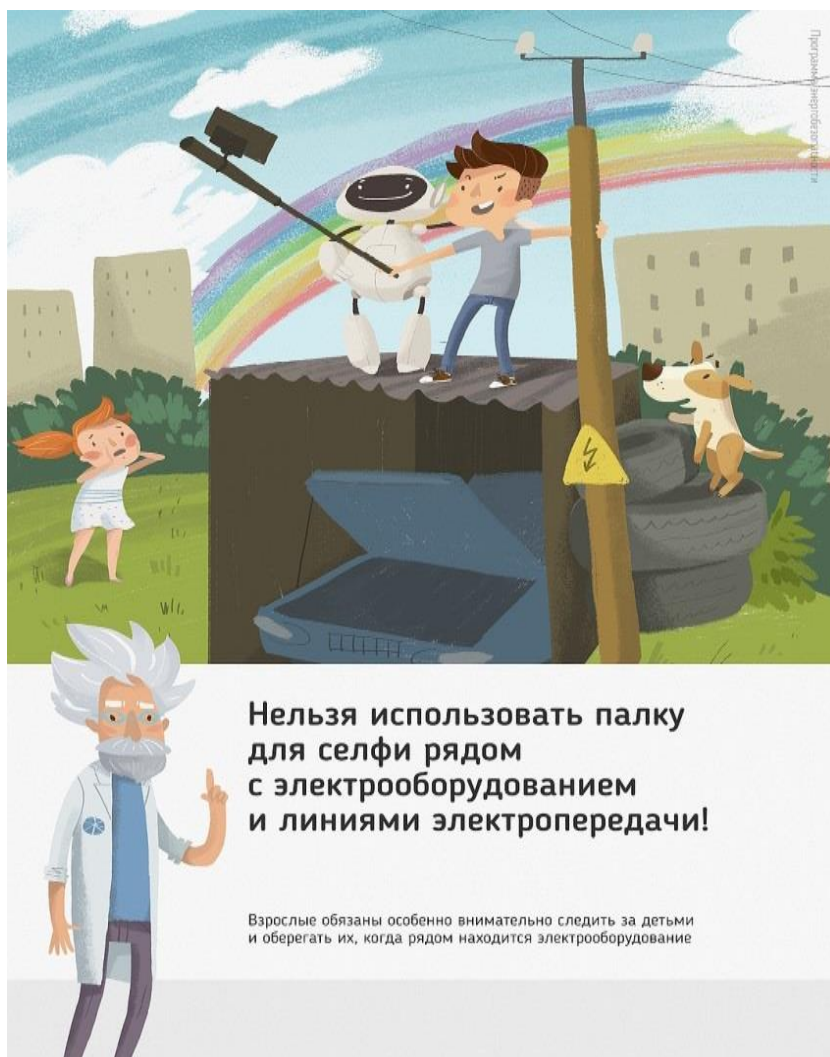
Рис 2. Нельзя использовать палку для селфи рядом с электрооборудованием и линиями электропередачи

Ну и, наконец, нужно повторить с ребенком алгоритм действий в экстремальной ситуации. Проверьте, умеет ли он набирать на сотовом телефоне телефон экстренных служб. Изучите с ним вещества и предметы, которые хорошо проводят электрический ток и потому особенно опасны, и, наоборот, вещества и предметы, плохо проводящие электрический ток и полезные в экстремальной ситуации.