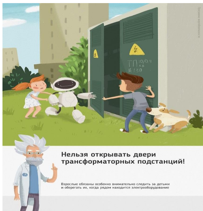
Рис.1 Нельзя открывать двери трансформаторных подстанций

Ежегодно энергетики проводят для школьников познавательные уроки, конкурсы рисунков и историй на тему электричества и правильного с ним обращения. Но работы одних энергетиков в данном направлении недостаточно, для полного понимания проблем электробезопасности нужен пример общества, в котором растет ребенок, и, конечно же, главным образом родителей. Эта работа приносит свои результаты: электротравмы на энергетических объектах единичные, и каждый случай становится поводом для служебной проверки. Но только технических мер мало для того, чтобы полностью обезопасить детей. Им нужен пример родителей.