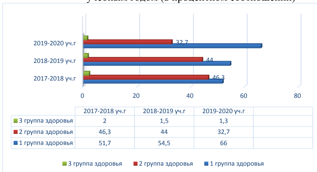
Анализ групп здоровья воспитанников в сравнении с предыдущим учебным годом (в процентном соотношении)

4.1. Результаты работы по снижению заболеваемости: в сравнении с предыдущим в отчетном учебном году уровень заболеваемости воспитанников снизился.